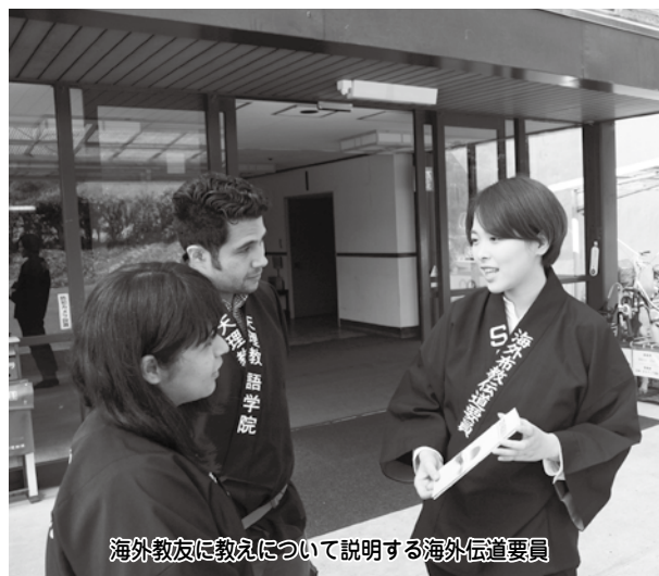
海外教友に教えについて説明する海外伝道要員

第一には、「海外伝道支援プログラム」という外国語のレッスンがあります。要員には大学での学習に加えてこのレッスンを受け、海外部員の指導のもと専攻言語（日本語教育を含む）を強化していただきます。第二に、各要員には海外部員カウンセラーが1名つき、信仰面、学