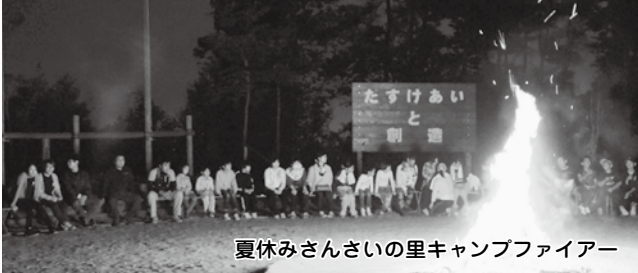
夏休みさんさいの里キャンプファイアー