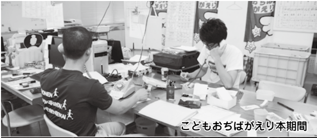
こどもおちばがえり本期間