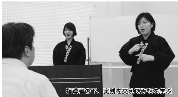
指導者の下、実践を交えて手話を学ぶ

また、当課では、要員が互いに信仰を深め、ようぼくとして共に社会福祉活動を進めてもらえるよう支援を行います。